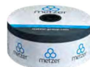
Темно-серая полоса на торце упаковки – 8 mil (0.2 мм) и выше