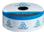
Синяя полоса на торце упаковки – 6 mil (0.15 мм)

» Таблицы содержат общую информацию. Для получения точных данных, пожалуйста, воспользуйтесь программным продуктом «Irrimeter».